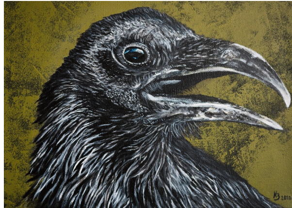
Gefieder 9 – Rabe

»» Tko traži, taj nađe. Wer suchet, der findet. ««